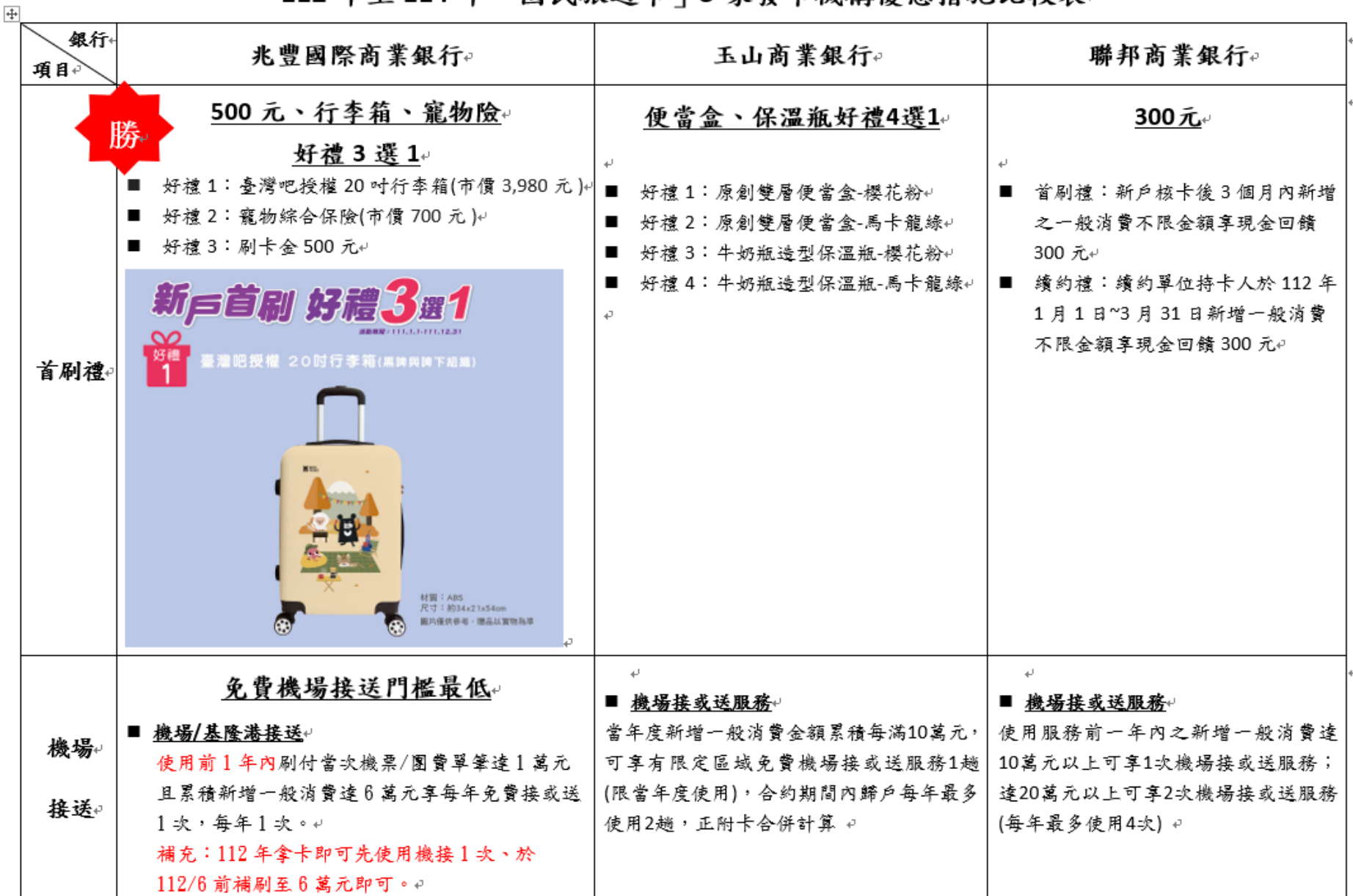
112 年至 114 年「國民旅遊卡」3 家發卡機構優惠措施比較表