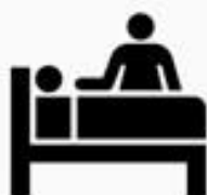
照顧 生活不能自理 的受隔離或檢疫者 之 家屬