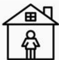
居家 隔離 者