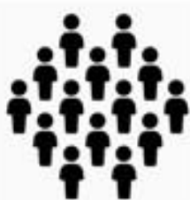
集中 隔離 者