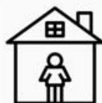
居家 檢疫 者