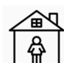
居家 檢疫 者