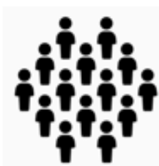
集中 隔離 者