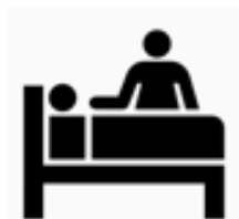
照顧 生活不能自理 的受隔離或檢疫者 之 家屬