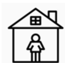
居家 隔離 者