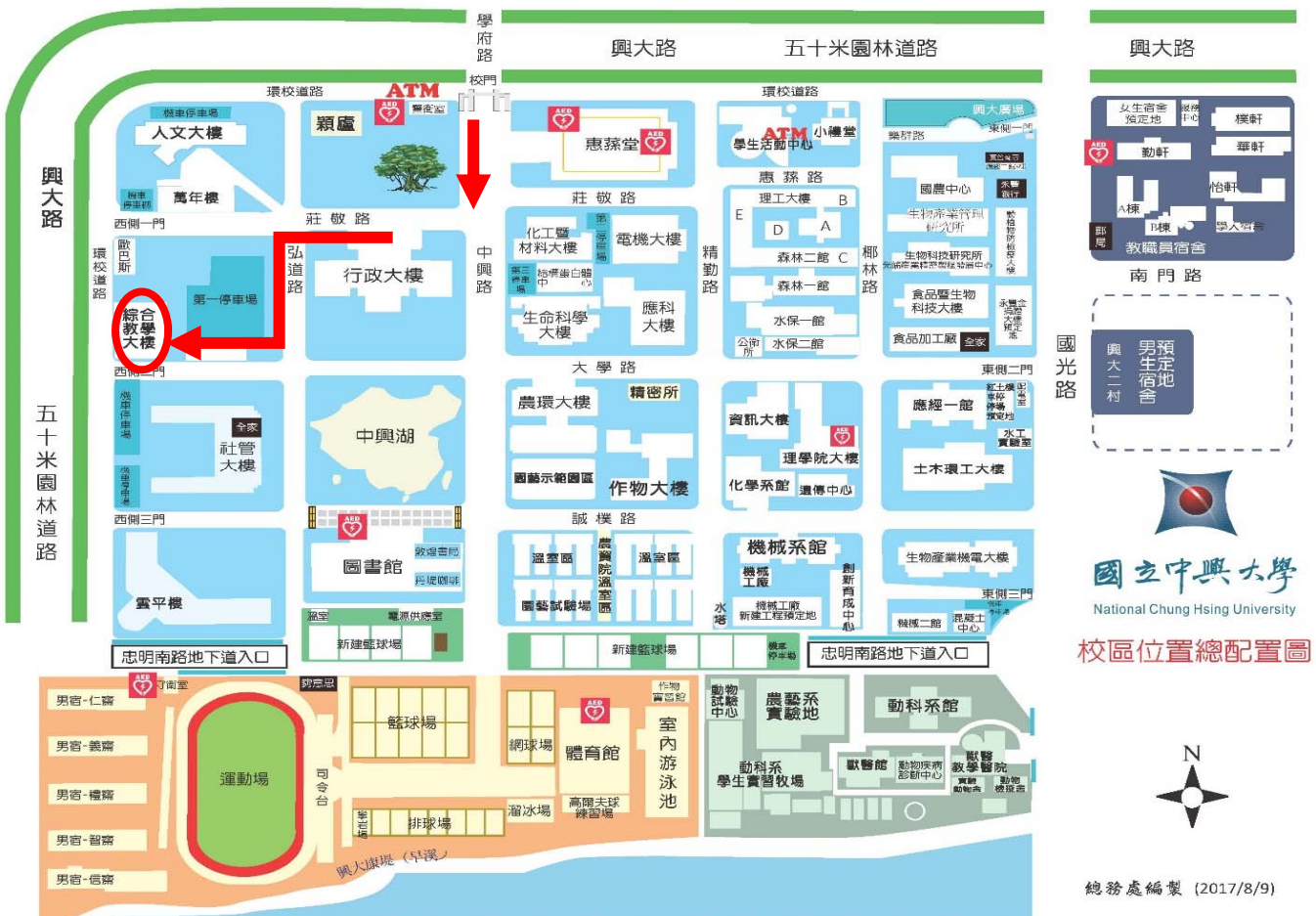
校區位置總配置圖